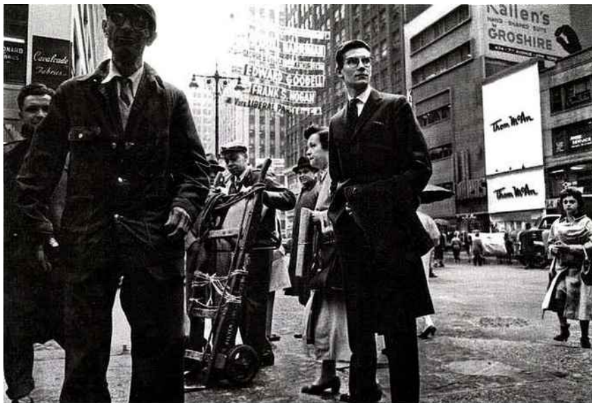
Dauman, un photographe tout-terrain. Ci-contre : Yves Saint Laurent sur la 5 e Avenue, en 1958. A droite : manifestation pro-castriste devant l'ONU, en 1961.

E lvis Presley en noir et blanc. Resplendissant, il revient du service militaire et pose devant un gâteau d'anniversaire en forme de guitare offert par l'un de ses nombreux fans... Jackie Kennedy en couleurs. Voilée, elle se penche sur le drapeau américain couvrant le cercueil de son mari... On connaît ces photos sublimes mais le nom du photographe ? Cette injustice sera heureusement bientôt réparée puisqu'on pourra découvrir l'œuvre passionnante d'Henri Dauman dans l'incroyable salle hypostyle du palais d'Iéna, à Paris.