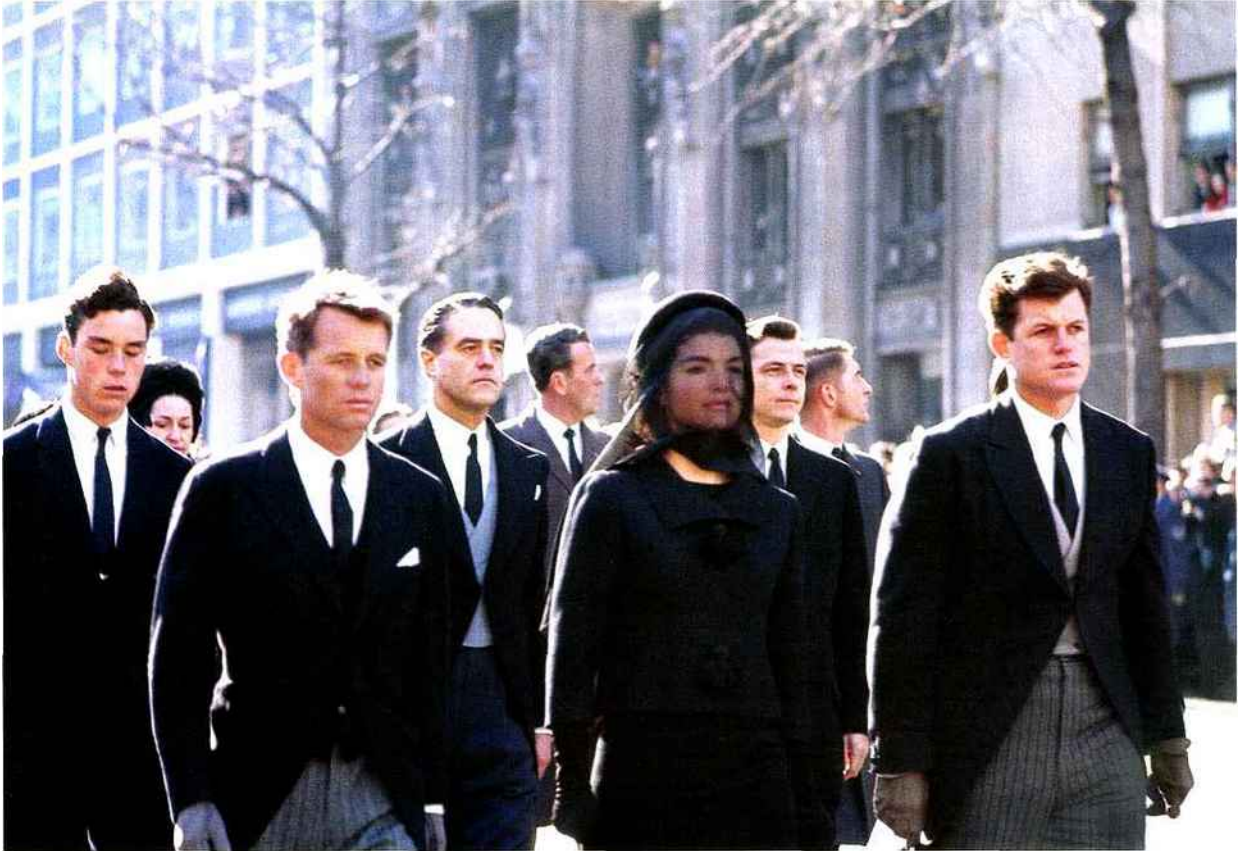
Les funérailles de John F. Kennedy (ci-dessus), le 25 novembre 1963. Une image reprise ensuite par Andy Warhol dans son tableau « 16 Jackies ». Ci-dessous : « Jane Fonda, New York, 1963 ». L'actrice américaine est une des nombreuses célébrités « capturées » par l'objectif unique du photographe français.